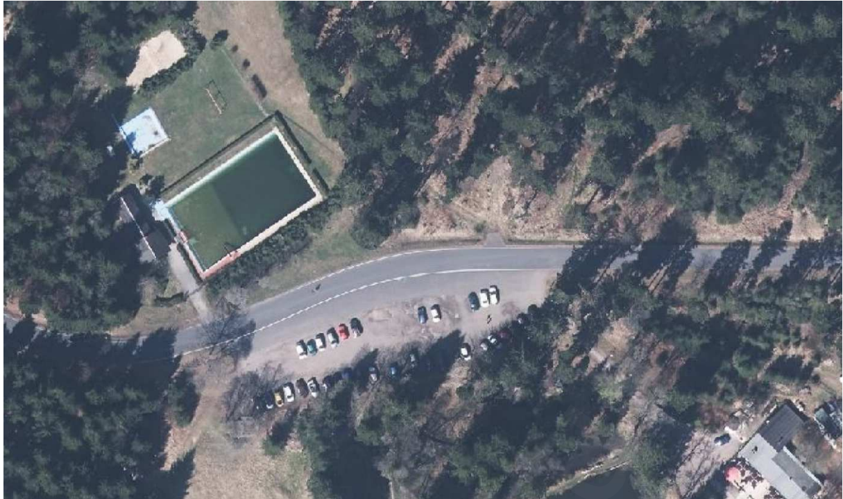
Abb. 1: Luftbild o.M.